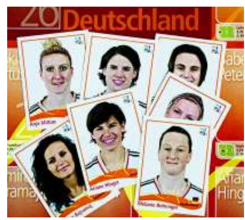
Frauenpower: Panini-Sticker