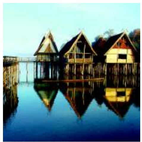
Pfahlbauten am Bodensee